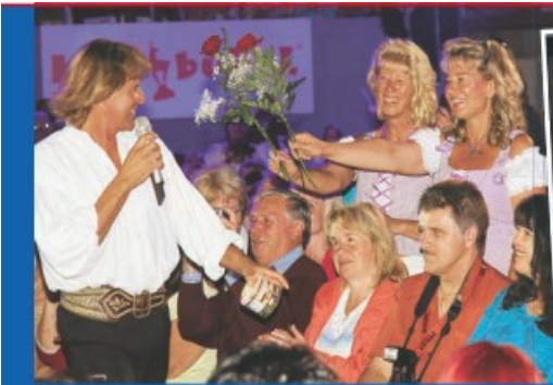
Begeisterte Fans überreichen dem Volksmusiker Blumen: Hansi Hinterseer begeistert mit seiner Musik und mit seinen Konzerten Millionen Menschen