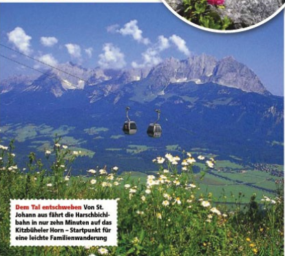
Dem Tal entsteigen Von St. Johann aus fährt die Harschbichlbahn in nur zehn Minuten auf das Kitzbüheler Horn - Startpunkt für eine leichte Familienwanderung.