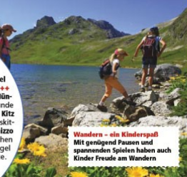
Wandern - ein Kinderspaß! Mit genügend Pausen und spannenden Spielen haben auch Kinder Freude am Wandern.

+++ Das mondäne Kitzbühel liegt auf 760 Metern Höhe. +++ Von Innsbruck, Salzburg und München ist die Stadt rund eine Stunde entfernt. +++ Der Namensteil Kitz hat nichts mit Reh- oder Gamskitzen zu tun. Er stammt von Chizzo ab, dem Namen einer bayerischen Sippe, die sich auf einem Hügel (Bühel) niedergelassen hatte.