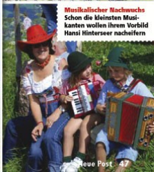
Musikalischer Nachwuchs Schon die kleinsten Musikanten wollen ihrem Vorbild Hansi Hinterseer nachzueifern.