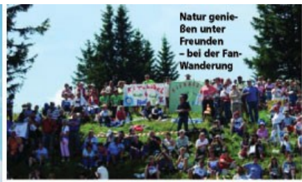
Natur genießen unter Freunden – bei der Fan-Wanderung

Sie fahren von Kitzbühel kommend über Reith, Going und Ellmau nach Scheffau. Von dort folgen Sie der Beschilderung zum Hintersteiner See. Die Rundtour dauert fünf bis sechs Stunden. Möglichkeiten zum Einkehren haben Sie beim Seestüberl, Goingstätt, Gasthof Maier, Stöflehütte, Walleralm und Wagenhof.