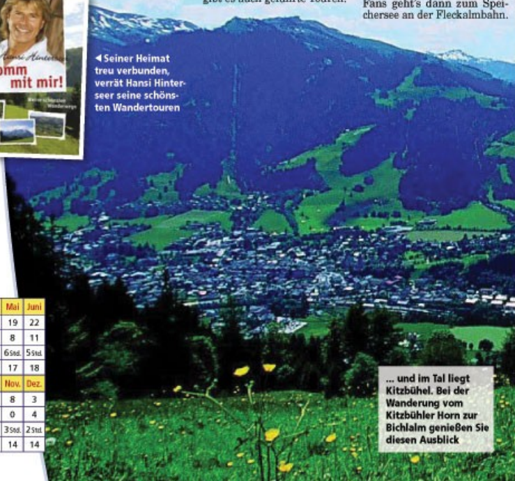
... und im Tal liegt Kitzbühel. Bei der Wanderung vom Kitzbühler Horn zur Bichlalm genießen Sie diesen Ausblick

◀ Seiner Heimat treu verbunden, verrät Hansi Hinterseer seine schönsten Wandertouren