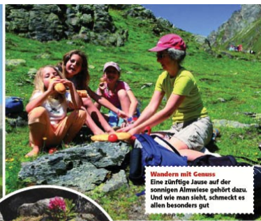
Wandern mit Genuss Eine zünftige Jause auf der sonnigen Almweide gehört dazu. Und wie man sieht, schmeckt es allen besonders gut.